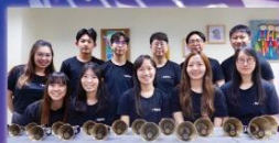
李鈴隊 Volatile Rogers

The Silent Night 寂靜之夜 O Praise the Lord! 噢讚美主 • He Watching Over Israel 祂保守看顧以色列